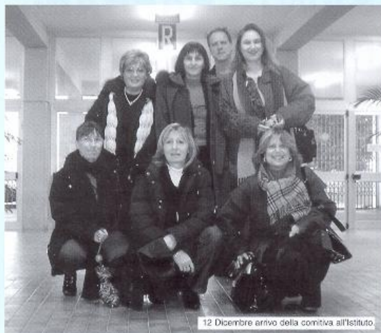
12 Dicembre arrivo della comitiva all'Istituto

Questo inventario sarà il punto di partenza per lo sviluppo di una "Direttiva Europea per la valoriz-